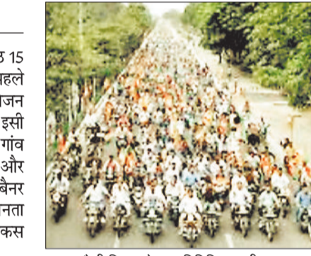
बाइक रैली निकालते जनप्रतिनिधि व ग्रामीण।

भारत माता के जय घोष सभी रास्तों पर घूमते रहे जहां से रैली गुजरी। रैली में शामिल सभी लोग देशभक्ति की भावना से ओतप्रोत रहे। उन्होंने अपने साथ कुछ स्टीकर भी रखे थे जिनका वितरण क्षेत्र के बच्चों और युवाओं को किया गया। यात्रा के मार्ग पर कई जगह ग्रामीणों के द्वारा स्वाधीनता रैली का स्वागत किया गया। विकासखंड मुख्यालय पोड़ी पहुंचकर रैली का समापन हुआ। इस अवसर पर क्षेत्र के प्रमुख जनप्रतिनिधियों ने अपनी राय रखी। उन्होंने कहा कि आज के दौर में स्वाधीनता की जानकारी सभी को होना जरूरी है लेकिन इस बात पर भी हमें ध्यान देना है कि