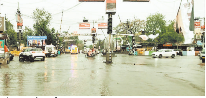
बारिश से तर बतर हुई शहर की सड़क।

बीते एक सप्ताह से मानसून की रफ्तार धीमी होने के कारण मौसम के तापमान में वृद्धि होने के साथ ही लोगों को उमस भरी गर्मी का सामना करना पड़ रहा था। वहीं दिन का तापमान 35 से 36 डिग्री सेल्सियस तक पहुंच चुका था। बीते दो दिन से शाम को बारिश होते ही मौसम में ठंडक आने के कारण आम लोगों को उमस की गर्मी से राहत महसूस हुई। मानसून की रफ्तार बीते एक सप्ताह से पूरे प्रदेश में धीमी पड़ी हुई है। भादों माह लगने के तीन दिन बाद