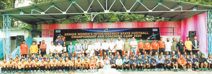
प्रतियोगिता में शामिल प्रतिभागी और आयोजक।

हरिभूमि न्यूज कोरबा कॉरपोरेट सामाजिक उत्तरदायित्व और जमीनी स्तर पर खेलों के प्रोत्साहन के प्रति अग्रणी अटूट प्रतिबद्धता के तहत, एनटीपीसी कोरबा ने छत्तीसगढ़ फुटबॉल एसोसिएशन के सहयोग से वरिष्ठ महिला अंतर-जिला राज्य फुटबॉल चैम्पियनशिप और कोचिंग कैंप का आयोजन वित्तीय वर्ष 2025-26 के सीएसआर बजट से किया है। एनटीपीसी कोरबा की लंबे समय से चली आ रही उस सोच को दर्शाती है, जिसके तहत खेल प्रतिभाओं को बढ़ावा देना, सामुदायिक भागीदारी को प्रोत्साहित करना और ग्रामीण युवाओं—विशेष रूप से महिलाओं—को संगठित खेल अवसरों के माध्यम से सशक्त बनाना शामिल है। वर्ष 2016 में शुरू हुई इस योजना ने अब तक कई राज्य, राष्ट्रीय और अंतरराष्ट्रीय स्तर के फुटबॉल खिलाड़ियों को तैयार करने में महत्वपूर्ण भूमिका निभाई है। 7-दिवसीय अंतर-जिला टूर्नामेंट जिला टीम के चयन ट्रायल्स में प्रतिस्पर्धा करती हैं। 21-दिवसीय कोचिंग कैंप शीर्ष 30 खिलाड़ियों को राज्य टीम बनाने के लिए प्रशिक्षित किया जाता है। अंतिम चयन 15-18 उत्कृष्ट खिलाड़ियों को छत्तीसगढ़ राज्य महिला फुटबॉल टीम का प्रतिनिधित्व करने के लिए चुना जाता है। वरिष्ठ महिला अंतर-जिला राज्य फुटबॉल चैम्पियनशिप की शुरुआत 8 अगस्त को एनटीपीसी कोरबा मैदान में किया गया। जिसमें आठ दमदार टीमों भाग ली। रोमांचक मुकाबलों के बाद 13 अगस्त को होने वाले भव्य फाइनल में डीएफए बस्तर और डीएफए दुर्ग आमने-सामने होंगे।