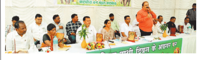
कार्यशाला में भागीदारों के बीच चर्चा।

विश्व हाथी दिवस के अवसर पर छत्तीसगढ़ के कटघोरा वनमंडल अंतर्गत बुका पर्यटन स्थल में एक विशेष कार्यशाला का आयोजन किया गया। इस कार्यशाला का मुख्य उद्देश्य ग्रामीणों और स्कूली बच्चों को जंगली हाथियों से उत्पन्न खतरों और उनसे सुरक्षित रहने के तरीकों के बारे में जागरूक करना था। वन एवं जलवायु परिवर्तन विभाग की इस पहल में कटघोरा वनमंडल के डीएफओ कुमार निशांत ने विस्तार से बताया कटघोरा वनमण्डल में इस वक्त 50 हाथियों का झुण्ड क्षेत्र में विचरण कर रहा है, कटघोरा वनमण्डल में पुरातनकाल से हाथियों की आबाद रही है लेकिन बीते 15 वर्षों से क्षेत्र में हाथियों का विचरण बढ़ता जा रहा है। यहां के लगभग 200 गाम हाथी प्रभावित हैं। अभी लोगों में नजावार भ्रम है लोग शिक्षित भी रहे हैं जिसकी वजह से लोगों में जागरूकता आ रही है और हाथी मानव झुंड में कमी आ रही है। कार्यशाला प्रमुख उद्देश्य है कि लगातार जंगली हाथियों के विचरण के बीच ग्रामीण कैसे अपनी सुरक्षा सुनिश्चित कर सकें हैं। उन्होंने कहा कि हाथियों के संरक्षण के साथ-साथ मनुष्य की सुरक्षा भी उतनी ही जरूरी है। कार्यक्रम के मुख्य अतिथि जिला पंचायत अध्यक्ष डॉ. पवन सिंह ने चिंता जताई कि हाथियों की बढ़ती संख्या से ग्रामीण क्षेत्रों में दहशत का माहौल है और फसलें भी बर्बाद हो रही हैं। उन्होंने वन विभाग की सतत निगरानी और इस प्रकार की जागरूकता कार्यशालाओं को बेहद जरूरी बताया। कार्यक्रम में वन विभाग के एसडीओ संजय त्रिपाठी, पीडी उपरोड तहसीलदार सुमन दास मलिकपुरी, केवई रेंजर अभिषेक दुबे, जडगा रेंजर, आरूपस के गाम सरपंच, जलपद रावत, पंचग तथा अन्य वन अधिकारी-कर्मचारी, स्कूली बच्चे और ग्रामीण बड़ी संख्या में मौजूद रहे।