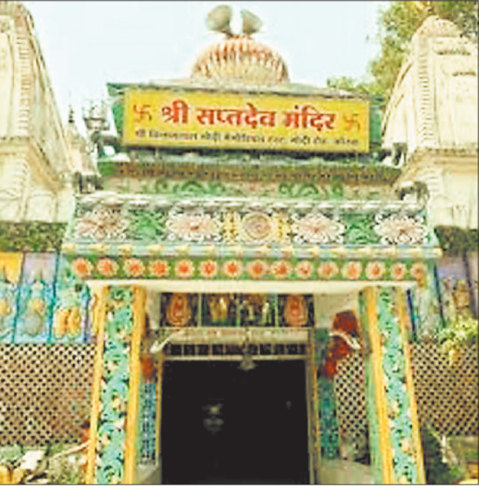
हरिभूमि न्यूज कोरबा

आगामी शनिवार को मनाई जाने वाली श्रीकृष्ण जन्माष्टमी को मनाने के लिए शहर और उपनगरीय क्षेत्रों में समितियों के द्वारा तैयारियां की गई हैं। कहीं मटकी फोड़ प्रतियोगिता आयोजित होगी तो बच्चों के लिए कृष्ण बनो, तो कहीं लड्डू गोपाल प्रतियोगिता का आयोजन किया जाएगा। इस दौरान मटकी फोड़ प्रतियोगिता हेतु 11 हजार रुपए की भी घोषणा की गई है। श्री सप्तदेव मंदिर में श्रीकृष्ण जन्माष्टमी उत्सव की तैयारियां शुरु श्री सप्तदेव मंदिर में मनाया जाने वाला श्रीकृष्ण जन्माष्टमी उत्सव की तैयारी शुरु हो चुकी है। यहाँ यह पर्व मथुरा और