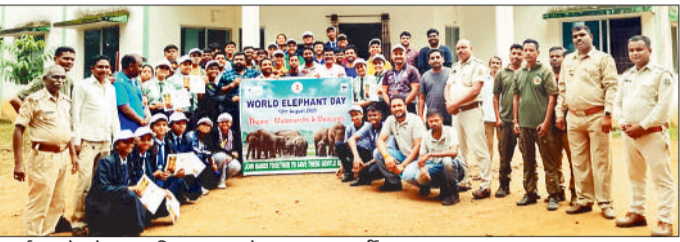
कार्यक्रम के दौरान उपस्थित स्कूल के छात्र व वनकर्मी।