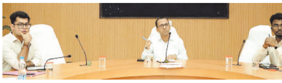
बैठक लेते कलेक्टर।