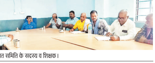
बैठक में उपस्थित समिति के सदस्य व शिक्षक।