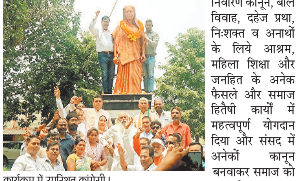
कार्यक्रम में उपस्थित कांग्रेसी।