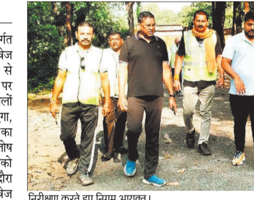
निरीक्षण करते हुए निगम आयुक्त।