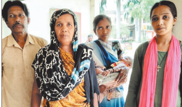
मृतक के परिजन।