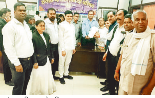
नामांकन दाखिल करते अधिवक्ता।